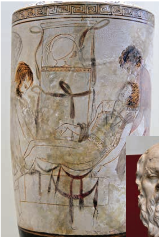
Hypnos und Thanatos betten Sarpedon (griechische Lekythos, Ölgefäß, ca. 440 v. Chr.).

Im antiken Griechenland erzählte man sich gerne Göttergeschichten. Die Göttin der Nacht zum Beispiel bekam zwei Söhne: Hypnos (den Schlaf) und Thanatos (den Tod). Sie sind Zwillingbrüder. Obwohl sie eng miteinander verwandt und in vielem ähnlich sind, gibt es Unterschiede. Im Schlaf kommt Gott eher freundlich und sanftmütig daher und befreit die Menschen zumindest für diese Zeit von ihrem Leid und ihren Schmerzen. Grausam und hart dagegen begegnet einem der Tod, des Schlafes Bruder.