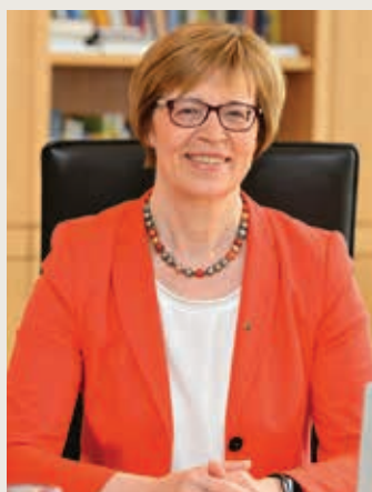
Gisela Bornowski.

Gisela Bornowski, Regionalbischöfin des Kirchenkreises Ansbach-Würzburg, ist vom Berufungsausschuss der Evangelisch-Lutherischen Kirche in Bayern (ELKB) wiedergewählt worden. Damit kann sie bis zum Erreichen der gesetzlichen Altersgrenze am 31. Dezember 2027 ihr Amt als Regionalbischöfin weiter ausüben.