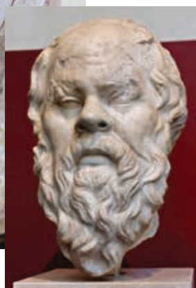
Sokrates, Büste aus Rom 1. Jh. n. Chr., Archäologisches Nationalmuseum Neapel.