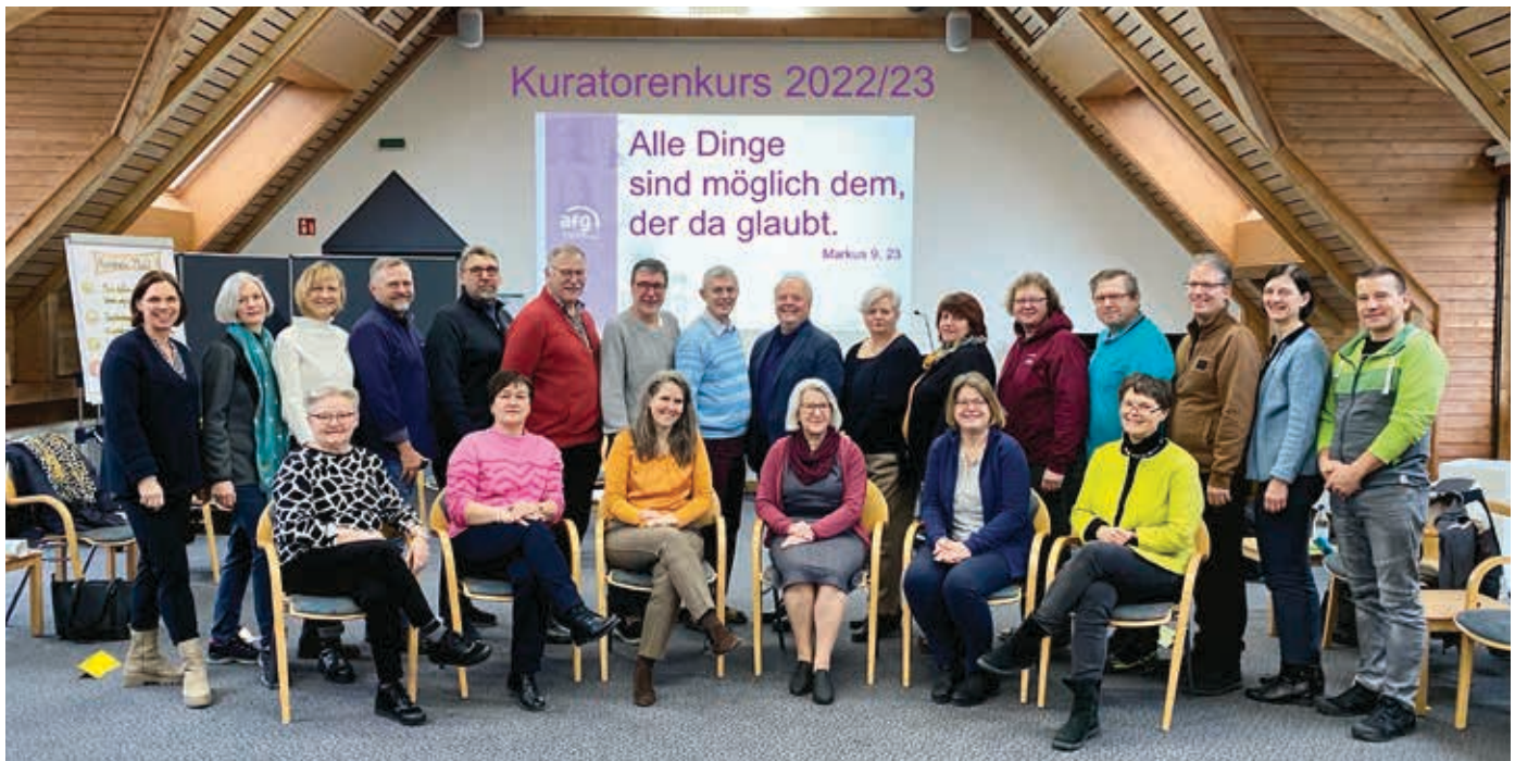
Die Teilnehmer und Kursleiter des ELKB-Kuratoren- kurses 2022/23.