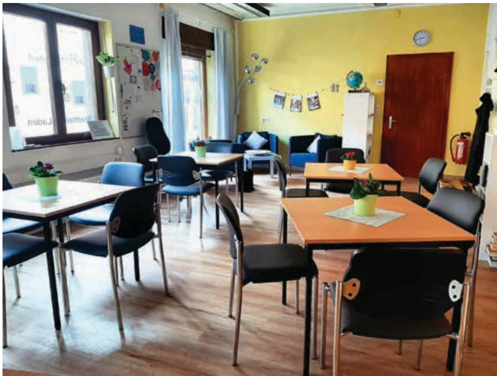
StadtteilLaden Interieur.

■ Diakonie Würzburg e.V., IBAN DE73 7902 0076 0001 1120 23 (Hypo-Vereinsbank)