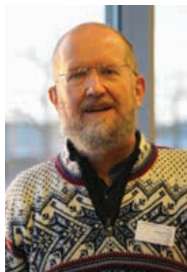
Jürgen Floß.