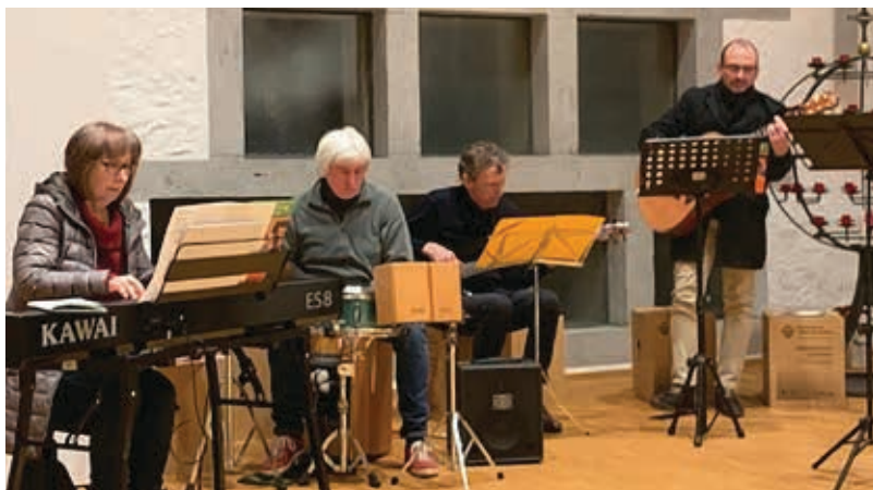
Band in der Christuskirche.