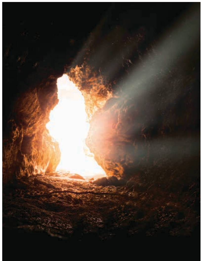
Offenes Grab.