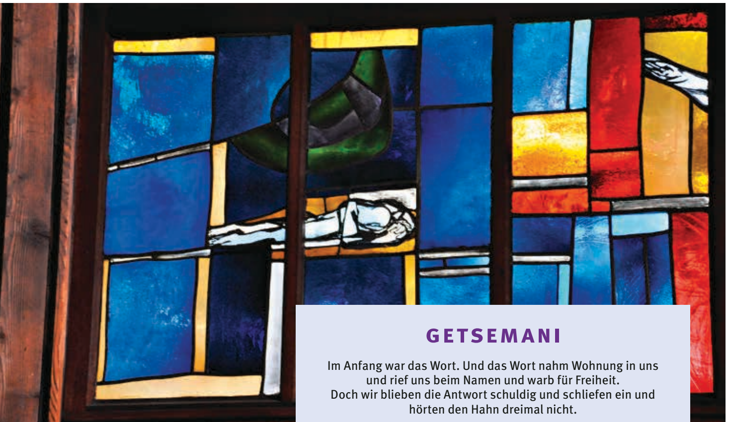
Gethsemaneszene. Glasfenster in der Martin-Luther-Kirche Würzburg. Künstler: Gerd Jähnke, München 1966.